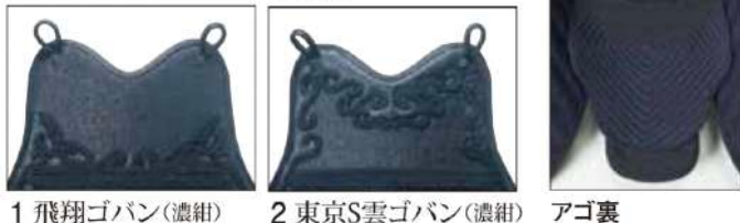
1 飛翔ゴバン(濃紺) 2 東京S雲ゴバン(濃紺) アゴ裏