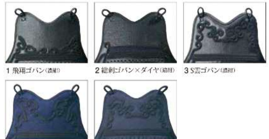
1 飛翔ゴバン(濃紺) 2 総刺ゴバン×ダイヤ(濃紺) 3 S雲ゴバン(濃紺)