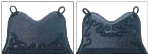
1 飛翔ゴバン(濃紺) 2 東京S雲ゴバン(濃紺)